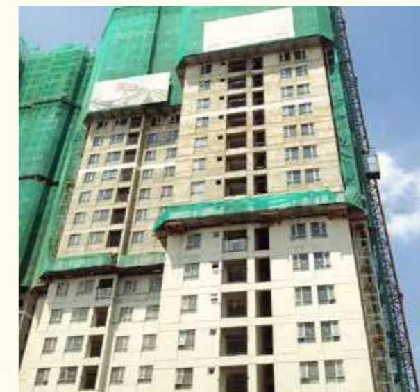
Tòa | Tower 2

Hoàn thiện xây tô mặt ngoài | Completing exterior painting