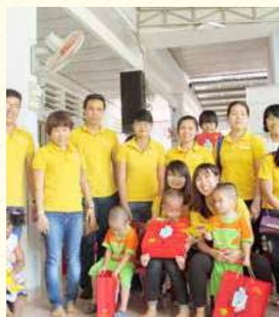
Mái ấm Hoa Hồng – Củ Chi Rose Homes, Cu Chi