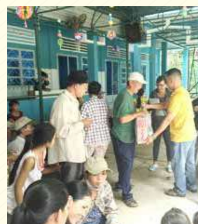
Mái ấm Phan Sinh – Đồng Nai Phan Sinh Homes, Dong nai