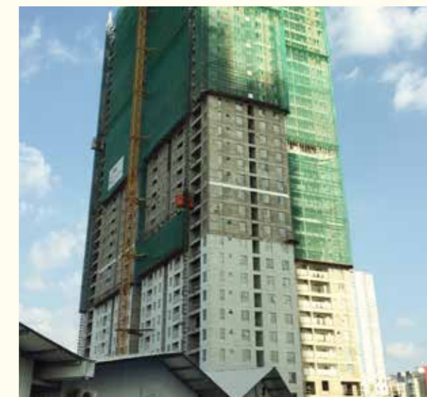
Tòa | Tower 4

Hoàn thiện xây tô mặt ngoài | Completing exterior painting