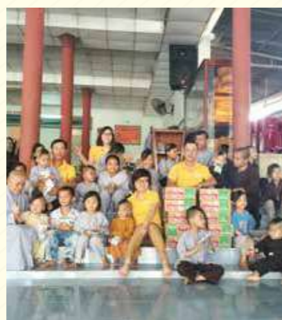
Cơ sở xã hội Hoa Sen Trắng, Tịnh xá Bửu Sơn – Đồng Nai White Lotus social homes, Buu Son monastic, Dong Nai