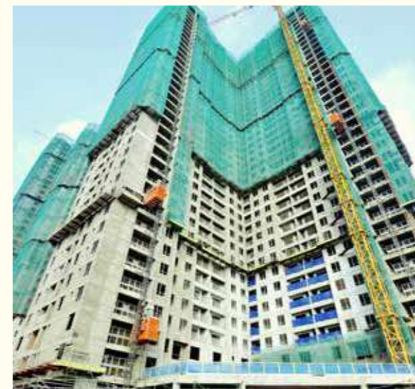
Tòa | Tower 1

In December this year, mock up units will be officially opened to visitors. We are looking forward to our customer's feedback!