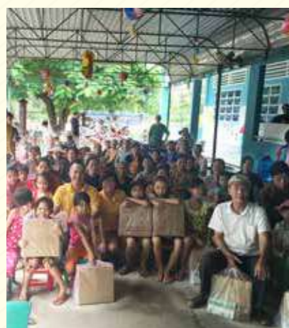
Xã Thanh Sơn - Phương Lâm - Đồng Nai Thanh Son Commune - Phuong Lam - Dong Nai

10 days before the full moon festival, Masteri staff made a charity trip and handed out gifts to charities and monastics in HCMC, Dong Nai and Ben Tre. This heartfelt activity brought joy and laughter to children who desperately need it.