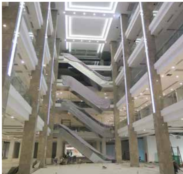
Hình chụp tiến độ thực tế tháng 11.2015 Photo taken in Nov 2015

Ngoài ra, những cư dân sống tại quận 2 và các khu vực xung quanh cũng được hưởng các tiện ích vui chơi giải trí cao cấp và hiện đại như cụm rạp chiếu phim công nghệ mới nhất, khu phức hợp games dành cho trẻ em.