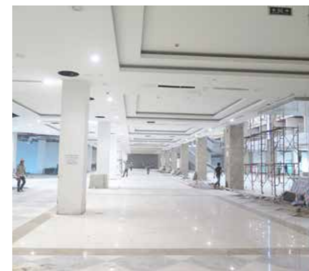
Hình chụp tiến độ thực tế tháng 11.2015 Photo taken in Nov 2015

Vingroup's Vincom Mega Mall Thảo Điền will have 05 floors and 03 basement. The project has various amenities for residents and creates a new entertaining "hot spot" for HCMC citizens.